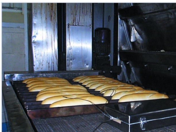
Einsatz in der Lebensmittelproduktion

Der Anwender profitiert von dieser einfachen Möglichkeit, die Übereinstimmung der Produktionsanlagen mit den gültigen Spezifikationen dokumentieren zu können. Mit diesen Diagnosemöglichkeiten können Energieverbrauch und Produktqualität optimiert werden.